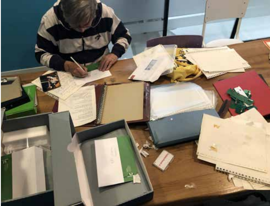
Overdracht archief Heero Viel.