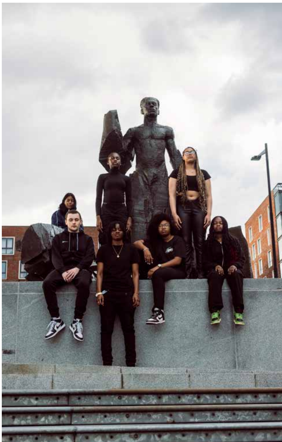
Crew JTSZO Daar. Tegen. Over.

* Reserveren via Eventbrite , check QR-code of 'JTSZO Theaternadedam Daar. Tegen. Over.'