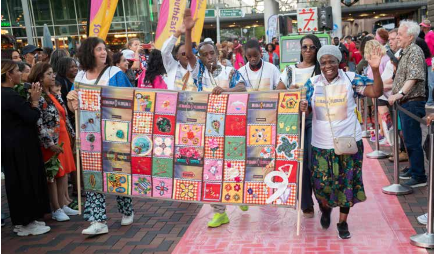
SouthEast Parade 2022.

De Surinaamse Mamjo is een deken die bestaat uit diverse stukjes stof. Vroeger werd de mamjo gemaakt uit restanten stof die men krijgen kon. Tegenwoordig is de mamjo van grote culturele betekenis en representeert een mamjo verhalen, tradities en technieken.