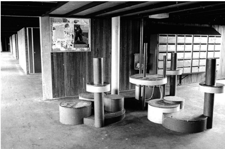
Kunst in de binnenstraat, F-buurt, archief Heero Viel.

Heero Viel is een van de trekkers van het Buurtplatform Mama Florijn en hij stelt zich graag aan u voor als 'Het historische geheugen van onze buurt'. Al