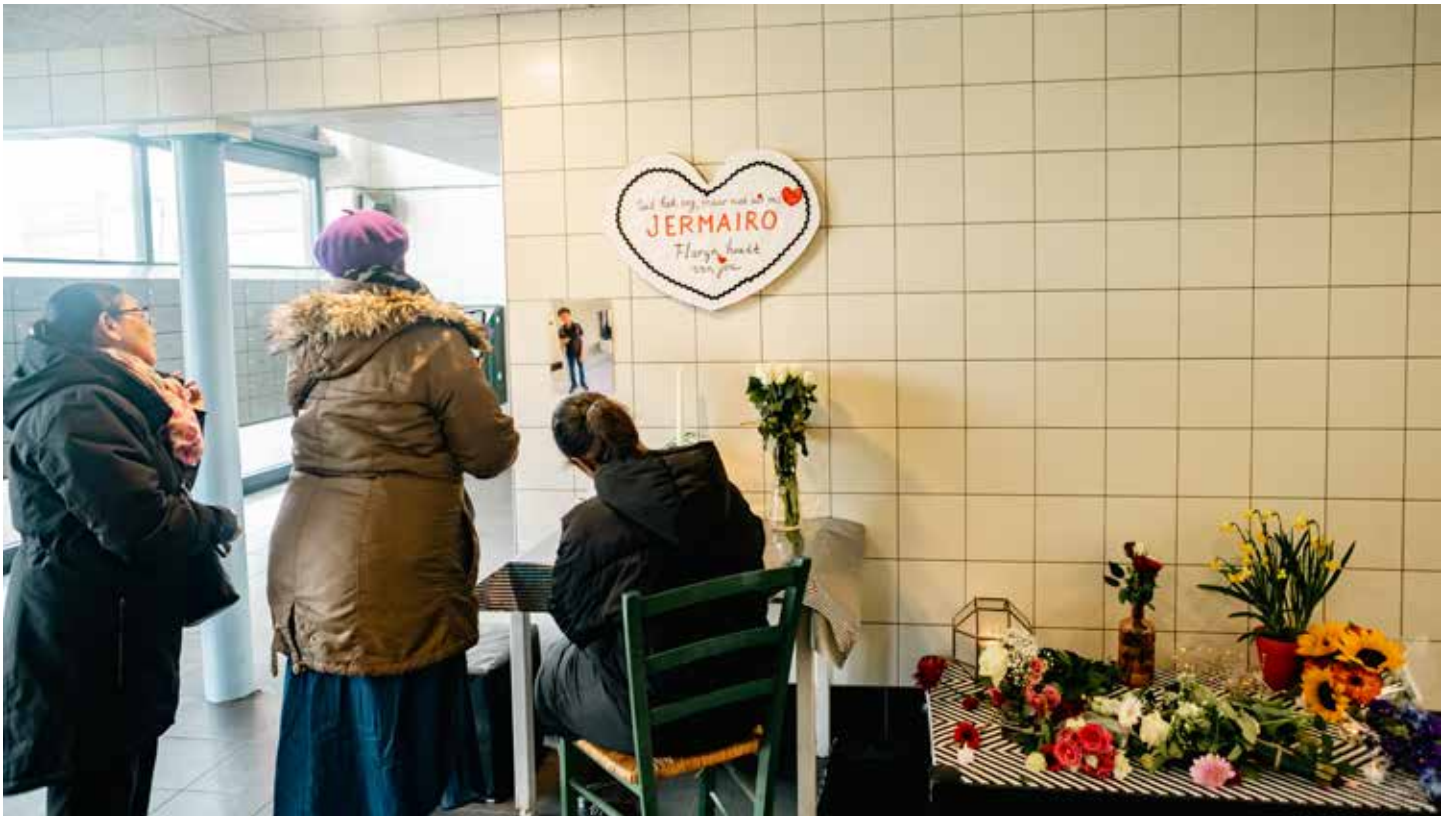
Gedenkplek Jamayro.