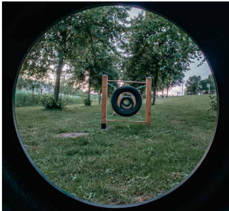
Mama Florijn - Made in Zuidoost

Bewoners met een hond hebben inmiddels laten weten erg blij te zijn met de nieuwe voorziening. De uitlaatstrook biedt volop ruimte en vormt een mooie ontmoetingsplek voor zowel viervoeters als hun baasjes.