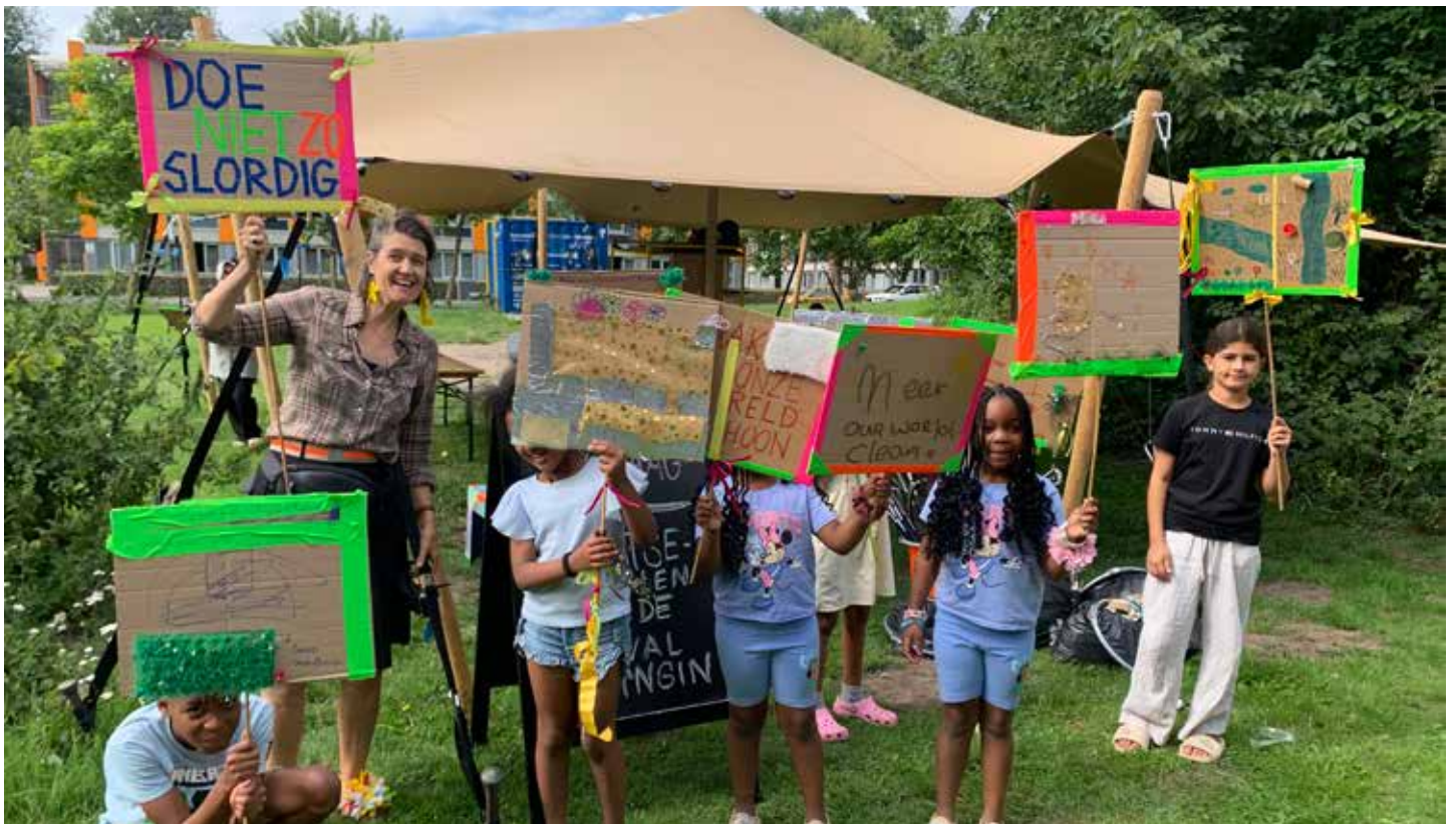
Zomerprogramma bij Florijn Vakantierrein.

Want een fijne buurt maak je niet alleen. Die bouwen we samen, stap voor stap, gesprek voor gesprek en initiatief voor initiatief. Veel leesplezier, een mooie zomer en hopelijk zien we elkaar binnenkort ergens in de buurt!