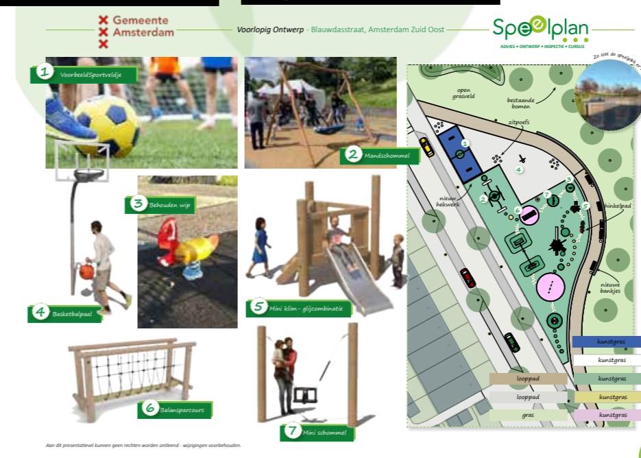
Flyer: Gemeente Amsterdam